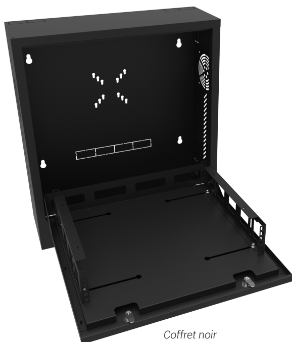
Coffret noir Rails en position 19"